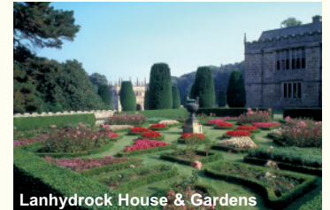
Lanhydrock House & Gardens